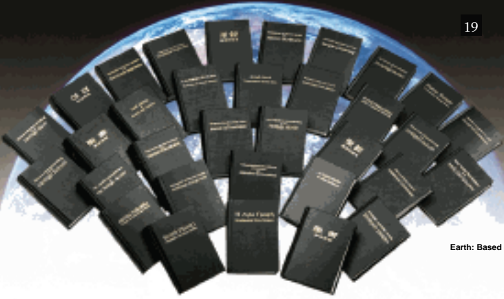
Earth: Based on NASA Photo

“न्यू वर्ल्ड ट्रांसलेशन ऑफ द होली स्क्रिपचर्स” आज कई भाषाओं में पाया जाता है