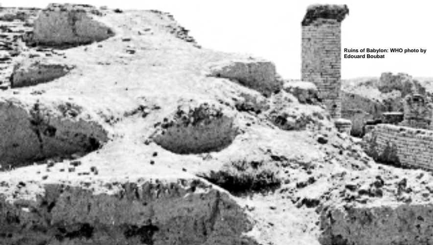
Ruins of Babylon

16. (क) यशायाह की भविष्यवाणी के मुताबिक वाबुल का अंजाम क्या हुआ? (ख) वाबुल के उजड़ जाने के बारे में यशायाह की भविष्यवाणी कैसे पूरी हुई?