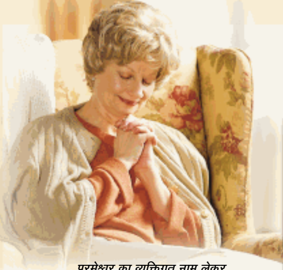
परमेश्वर का व्यक्तिगत नाम लेकर उससे दिल से प्रार्थना कीजिए

उनके साथ बाइबल का अध्ययन कीजिए जो वाकई उसमें दी गयी बातें सिखाते हैं