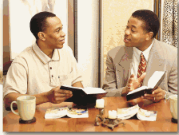
राज्यगृह में सभाओं के लिए हाज़िर होइए

उनके साथ बाइबल का अध्ययन कीजिए जो वाकई उसमें दी गयी बातें सिखाते हैं